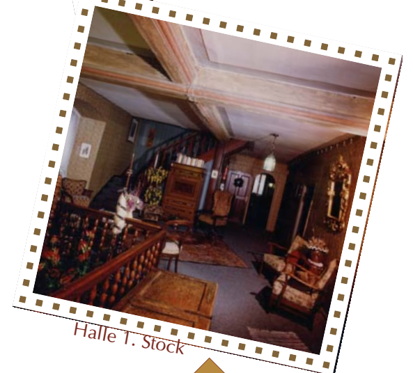
Halle 1. Stock